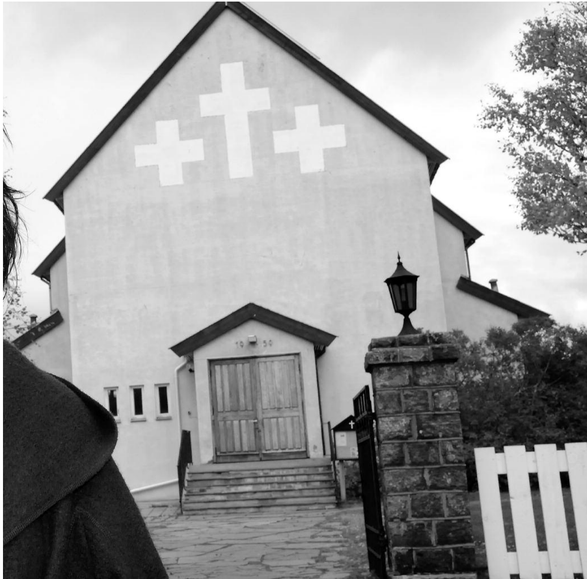
norske gudstjenesten. Men hun krever lenger høringsfrist for menigheten i Sør-Varanger.

er altfor kort tid. Det er mange i landet som har reagert. Jeg mener vi må få et år på oss. Ellers er jeg ikke sikker på om Sør-Varanger menighet skal være med på dette, sier soknepresten.