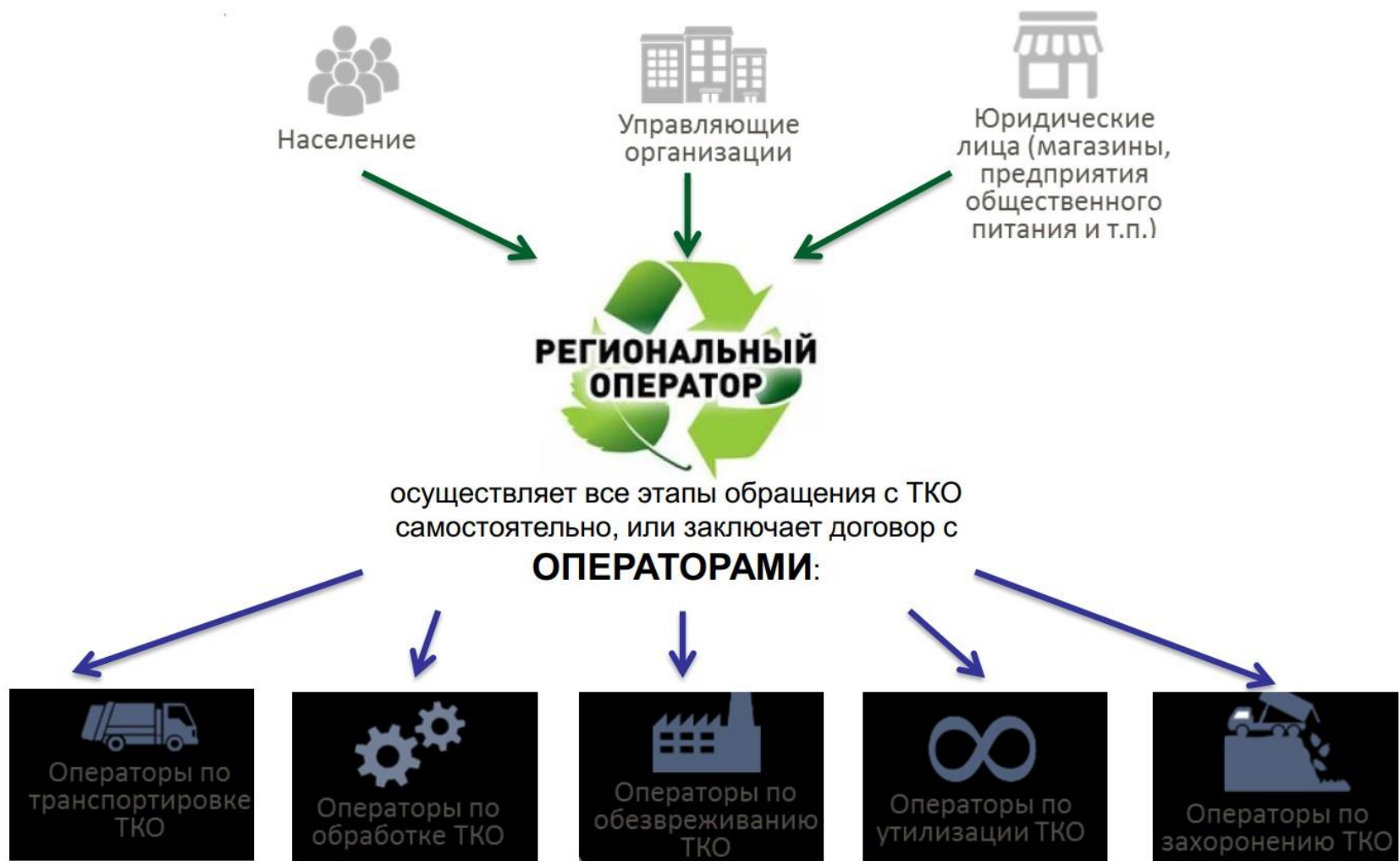
Схема договорных отношений с региональным оператором

Договорные схемы строятся на основании территориальной схемы обращения с отходами!